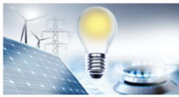
Puissance & Energie