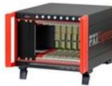
Systèmes intégrés, cartes fond de panier et alimentation