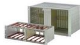
Bacs à cartes, coffrets et faces avant alimentation