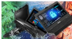
Mobilité Durcie & TEMPEST