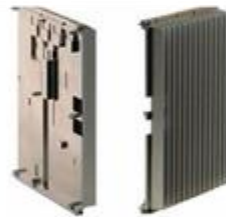
Conduction Cooled Assemblies (CCA) usinés