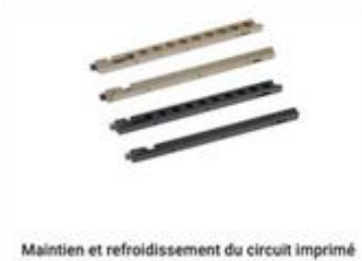
Maintenance et refroidissement du circuit imprimé