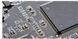
Optique & numérique