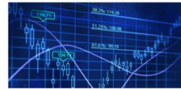
Instrumentation & Test