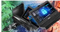
Mobilité Durcie & TEMPEST